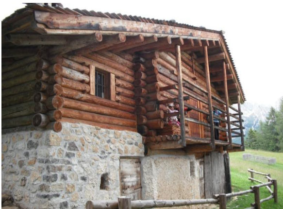
Baitha alpina in legno con piano terra in muratura.

Queste sostanze presentano alta tossicità verso gli organismi xilofagi ( insetti che vivono nel legno e di esso si nutrono, muffe e funghi ) e minore tossicità verso i mammiferi come l'uomo. Generalmente sono derivati dalla distillazione del carbon fossile (creosoto), sostanze in solventi organici e gas e più in generale fungicidi ed insetticidi ad azione combinata. Per il legname impiegato in edilizia a questi si aggiungono igniritardanti per incrementare il tempo di resistenza delle strutture sotto attacco del fuoco.